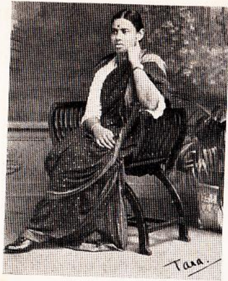
अमरावती में ताराबाई आ गयी है। (१९१५)